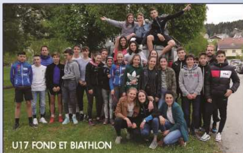
U17 FOND ET BIATHLON