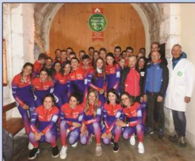
Soirée des partenaires au FORT SAINT ANTOINE